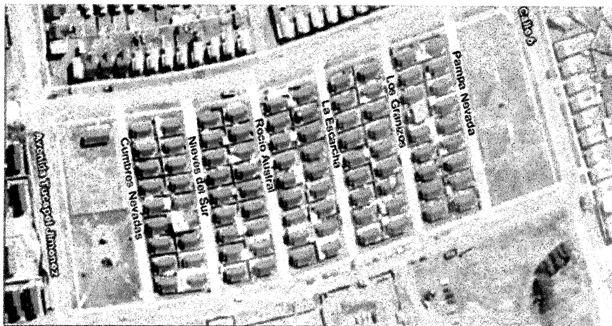
IMAGEN DE LOS PASAJES CON LOS NOMBRES Y A CONTEMPLAR EN EL PROYECTO "CONSTRUCCIÓN E INSTALACIÓN DE SEÑALÉTICAS IDENTITARIAS"

Que, habiendo sala legalmente constituida y atendidos los antecedentes indicados. Se alcanza el siguiente: